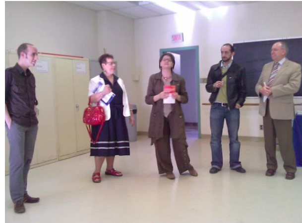
Lancement de deux ouvrages

l'expertise passée de la titulaire ainsi qu'à une visibilité importante de la Chaire dans le débat public et médiatique.